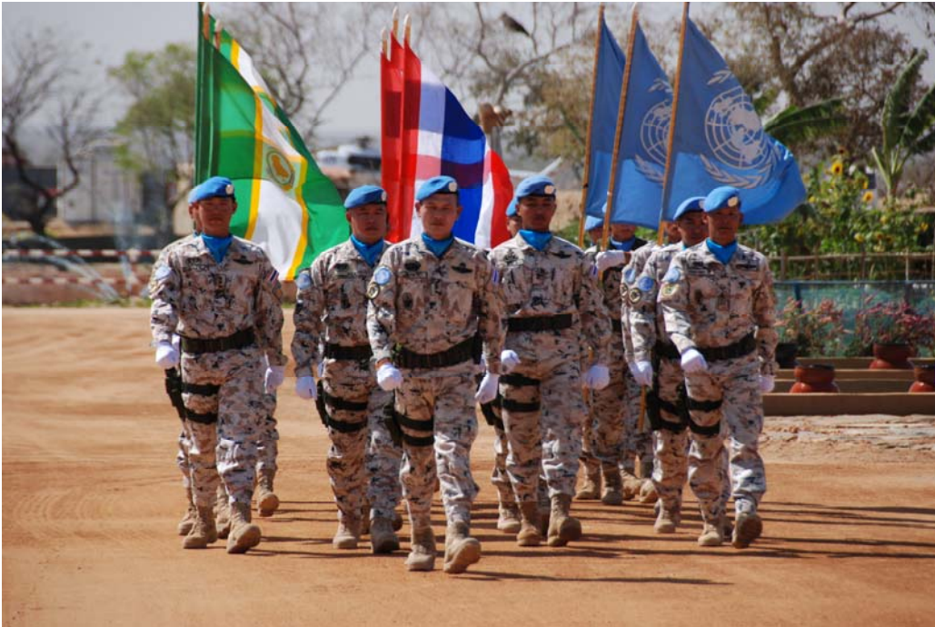
ร้อย.ช. กกล.ฉก.๙๘๐ ไทย/ดาร์ฟัวร์ ผลัดที่ ๒ พิธีรับกำลังพล ณ บก.กช. วันที่ ๓ ก.ค. ๕๕