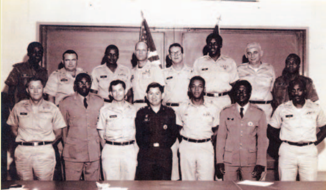
ภาพถ่ายวันสำเร็จการศึกษาหลักสูตร EERTC กับเพื่อนทหารสหรัฐอเมริกา

ท่านทูตได้กรุณาประสานไปยังเพนตากอน (กระทรวงกลาโหมสหรัฐอเมริกา) เรียกชื่อว่า PENTAGON ตามรูปแบบอาคาร คือเป็นอาคารที่มีรูปร่างห้าเหลี่ยม ถ้าฝรั่งเรียก PENTAGON เขาหมายความว่า เป็นชื่อกระทรวงกลาโหม หรือศูนย์การทหารของสหรัฐอเมริกานั้นเอง อาคารนี้เคยถูกคนร้ายขับเครื่องบินพุ่งเข้าชนในเหตุการณ์ NINE ONE ONE 911 (วันที่ ๑๑ เดือน กันยายน)