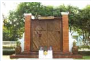
◎ ประตุมืองโบราณบานสุดท้าย ที่ยังคงสภาพความสมบูรณ์มากที่สุด