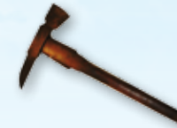
◎ ขวานทองอน

ในสงครามมหาเอเชียบูรพาทหารช่างสนับสนุนกองพลสร้างทางคมนาคม โดยใช้เครื่องมือช่างสมัยโบราณได้แก่ พลั่ว จอบ ใช้ขุดดิน ขวาน เลื่อย ใช้ตัด ถากถาง ลี้ว ขวาน ใช้ในงานไม้ ฯลฯ