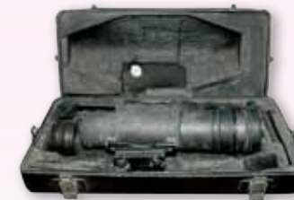
◎ กล้องสตาร์ไลท์สโคป ใช้ในสงครามเวียดนาม