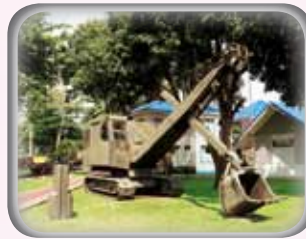
◎ รถปั้นจั่นประกอบถังตัดตัด