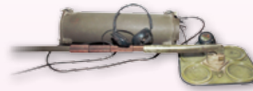
◎ เครื่องตรวจค้นทุระเบิด ใช้ในสงครามเวียดนาม