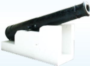
◎ ปืนใหญ่โบราณใช้รักษาเมือง ระหว่างปี พ.ศ. ๒๓๖๐ - ๒๔๔๘