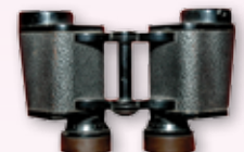
◎ กล้องส่องทางไกล