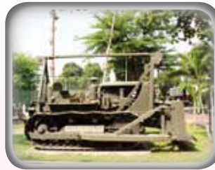
◎ รถถากถางล้อสายพาน