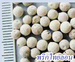
พริกไทยล่อน