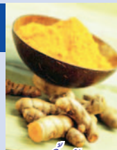
ขมิ้นชัน