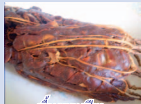
เนื้อมะขามเปียก