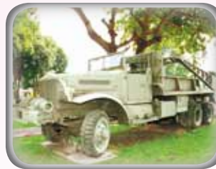
◎ รถสะพานขนาด ๖ ตัน