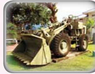
◎ รถดับกรรทุกขนาด ๒.๕ ลูกบาศก์ทลลา