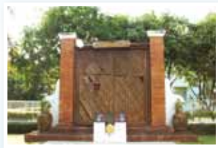
◎ ประติมากรรมโบราณสถานสุดท้าย ที่ยังคงสภาพความสมบูรณ์มากที่สุด