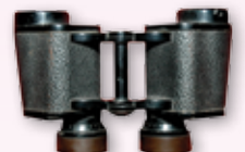
◎ กล้องส่องทางไกล