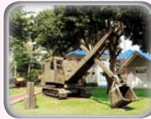
◎ รถปั้นจั่นประกอบถังตัดตัด