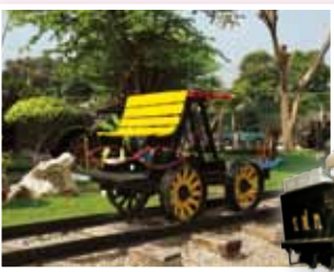
◎ รถโยกตรวจทางรถไฟ

ความยาว ๑,๓๖๑.๓๐ เมตร บนทางรถไฟสายเหนือ กิโลเมตรที่ ๖๘๒ เชื่อมต่อระหว่าง จ.ลำพูน กับ จ.ลำปาง คือ ผลงานแห่งความภาคภูมิใจที่ทหารช่างเข้าดำเนินการต่อจากวิศวกรชาวเยอรมันในสมัยสงครามโลกครั้งที่ ๑ สามารถเปิดเดินรถไฟลอดอุโมงค์ขุนตานได้เป็นครั้งแรก เมื่อ ๑ กรกฎาคม ๒๕๖๑