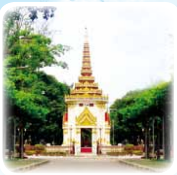
◎ ศาลเจ้าพ่อหลักเมืองราชบุรี

ที่ตั้งของกรมการทหารช่าง ในปัจจุบันเป็นศูนย์กลางเมืองราชบุรีเดิม ในสมัยรัชกาลที่ ๒ ที่มีความสำคัญ ทางยุทธศาสตร์ โดยทรงพระกรุณา โปรดเกล้าฯ ย้ายเมืองจากฝั่งขวาของ แม่น้ำแม่กลองมาตั้งทางฝั่งซ้าย และ โปรดเกล้าฯ ให้มีพิธีฝังหลักเมือง สร้าง กำแพงเมือง ป้อม ประตูเมือง และอื่นๆ ตัวเมืองราชบุรีแห่งนี้ใช้เป็นทั้งทำการ มาจนถึงสมัยรัชกาลที่ ๕