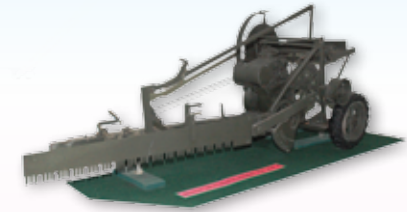
◎ เลื่อยโซ่ยนต์สมัยสงครามโลกครั้งที่ ๒