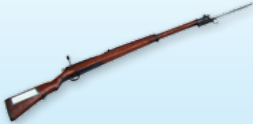
◎ ปืนเล็กยาวแบบ ๖๖