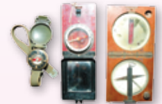
◎ เข็มทิศลับเสียง