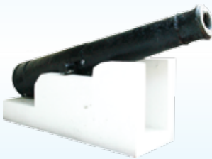
◎ ปืนใหญ่โบราณใช้รักษาเมือง ระหว่างปี พ.ศ. ๒๓๖๐ - ๒๔๔๘