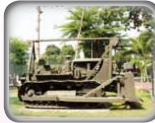
◎ รถถังกลางล้อสายพาน