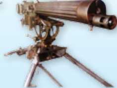
◎ ปืนกลหนักแบบ ๗๗