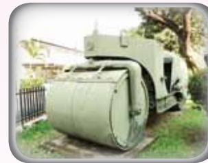
◎ รถบดล้อเหล็ก

ในสงครามมหาเอเชียบูรพาทหารช่างสนับสนุนกองพลสร้างทางคมนาคม โดยใช้เครื่องมือช่างสมัยโบราณได้แก่ พลั่ว จอบ ใช้ขุดดิน ขวาน เลื่อย ใช้ตัด ถากถาง ลี้ว ขวาน ใช้ในงานไม้ ฯลฯ